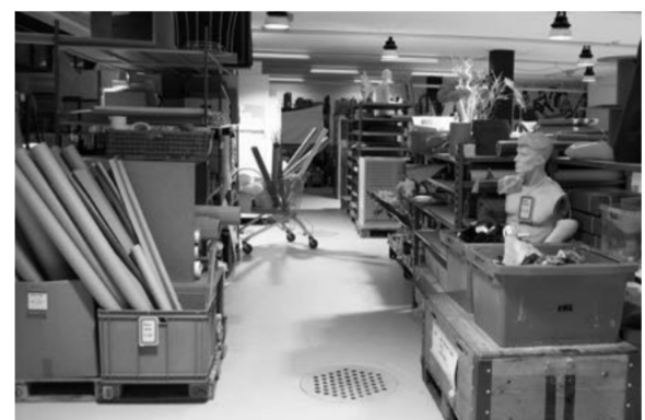
September «Ich war einmal ein Kanister», OFFCUT Luzern wagt gemeinsame Schritte mit der Hochschule für Design und Kunst Luzern in die Zirkularität.