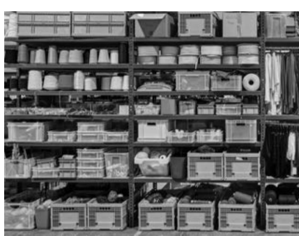
Februar «Die Materialmine der Kreislaufwirtschaft», so betitelt Ellexx.com OFFCUT Basel in einem Online-Artikel.