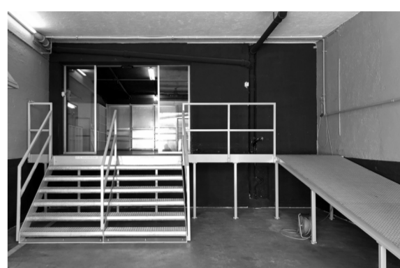
Oktober Der Materialmarkt in Zürich zieht an einen neuen Standort um.