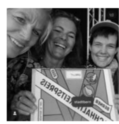
September «So sieht man aus, wenn man einen Nachhaltigkeitspreis gewinnt», OFFCUT Bern wird von der Stadt Bern honoriert.