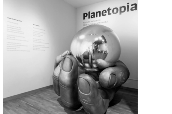
November «Planetopia – zu 90% aus wiederverwerteten Materialien und Objekten», OFFCUT Zürich setzt im Auftrag des Museums für Kommunikation in Bern ein Novum in der Schweizer Ausstellungs-Szenografie um.

Im Mai haben wir an unserer Retraite im Toggenburg wegweisende Weichen gestellt: Die Organisationsstruktur der Dachorganisation soll aufs Wesentlichste reduziert werden. Seither arbeitet die Zentrale Arbeitsgruppe Governance auf Hochtouren an der Umsetzung. An der Generalversammlung im Oktober wurde die Überarbeitung präsentiert und Feedback für die weitere Bearbeitung gesammelt. Bis im Mai nächsten Jahres wird das neue Kooperationsmodell fertiggestellt sein.