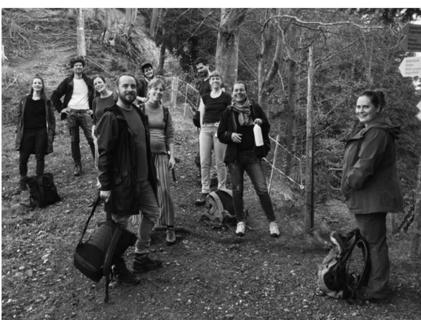
Mai «Reduzieren aufs Wesentliche», das Netzwerk geht Wandern im Toggenburg und überarbeitet und vereinfacht seine Organisationsstrukturen.