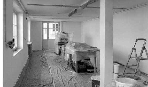
Oktober «Eröffnung im Osten», nach acht Monaten Aufbauphase macht in St. Gallen der fünfte OFFCUT Materialmarkt seine Türen für Kunden und Kundinnen auf.