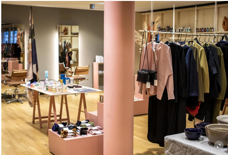
Coiffeur-Salon und Shop für lokale Labels in einem – der Laden This is Yours bringt neuen Wind in die Innenstadt.