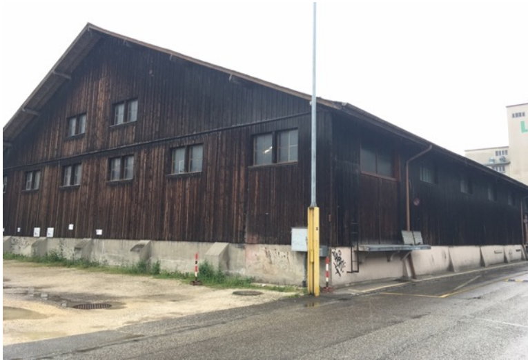
Neuer Standort Holzhalle Lyon-Strasse 11